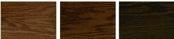
Light Walnut OB 83-803