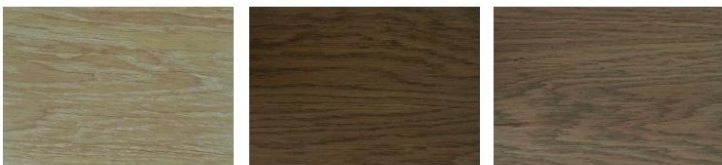
White OB 83-700

Hesse PARQUET COLOUR-OIL OB 83 -(Farbton) gibt es in folgenden attraktiven Farben: